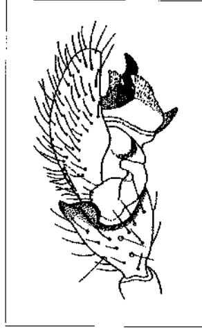
Abb. 1: Pedipalpus des Männchens von Eperigone trilobata (EMERTON, 1882)

Wahrscheinlich in den 1970er Jahren wurde die Baldachinspinne Eperigone trilobata nach Deutschland eingeführt. DUMPERT & PLATEN (1985) gelang der erste Nachweis für Deutschland 1976 in einem Buchenwald bei Eitlingen in der Nähe von Karlsruhe. Seit dem breitet sich die Spinne in Europa aus. Nachweise in Richtung Süden liegen von HÄNGGI (1990) für die Schweiz, von BREUSS (1999) für Österreich (nachgewiesen 1998) und von ZINGERLE (2000) und HANSEN (2003) für Italien vor. Auch in Richtung Westen liegen Nachweise vor: BLICK (1995) konnte die Linyphiidae 1994 in Frankreich nahe der deutschen Grenze bei Weil am Rhein nachweisen, LAM-BRECHTS (2003) in Belgien und der Autor hat zehn Männchen in den Jahren 2003 und 2005 für Luxemburg nachgewiesen. Es bleibt abzuwarten ob diese Art in den kommenden Jahren auch im Norden zu finden sein wird.